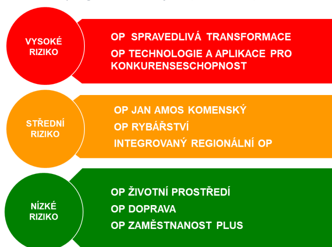
Obrázek 1 Rizikovost programů „semafor“ (únor 2025)

Hodnocení proběhlo v únoru 2025 na datech k 31. 12. 2024 . Základem pro hodnocení rizik byly zejména vstupy od řídicích orgánů (ŘO), data z monitorovacího systému MS2021+, vstupy od auditního orgánu, platebního orgánu a informace získané v rámci platformy a průběžné práce s ŘO . Z výsledků multikriteriálního hodnocení rizikovosti programů vyplynulo následující rozřazení programů do kategorií rizikovosti pro rok 2025 . Rizika jednotlivých programů jsou popsána v kap. 3.2.: