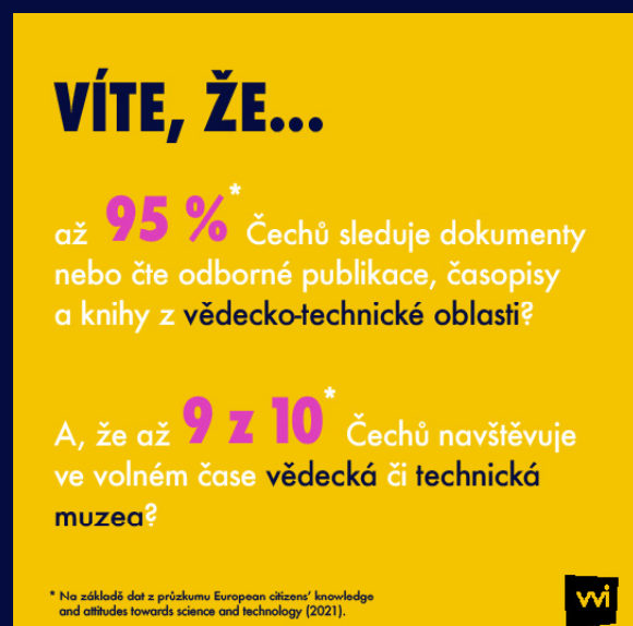
Obrázek 2 Víte, že...