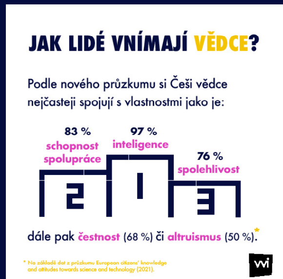
Obrázek 1 Jak lidé vnímají vědce?

Ve srovnání s průměrem států v EU 27 dotázaní čeští občané ve většině otázek týkajících se zájmu o vědu a technologie odpovídali více kladně (pro ilustraci obrázek 1 a 2).